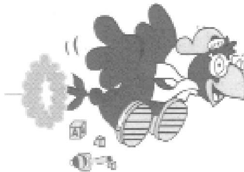
PLATE FORME PÉDAGOGIQUE CPE La Girouette inc.

Dernières modifications apportées : décembre 2011 Dernières modifications apportées : janvier 2010 Dernières modifications apportées : août 2002 Créé le : juin 2002